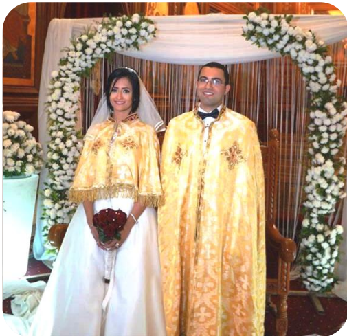
المجلة ترحب بنشر تهانيتكم و مناسبتكم السعيدة