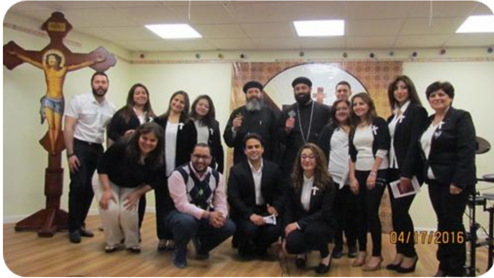
اجتماع صلاة وترانيم (فريق قلب يسوع)، يوم السبت الموافق ١٦ إبريل ٢٠١٦