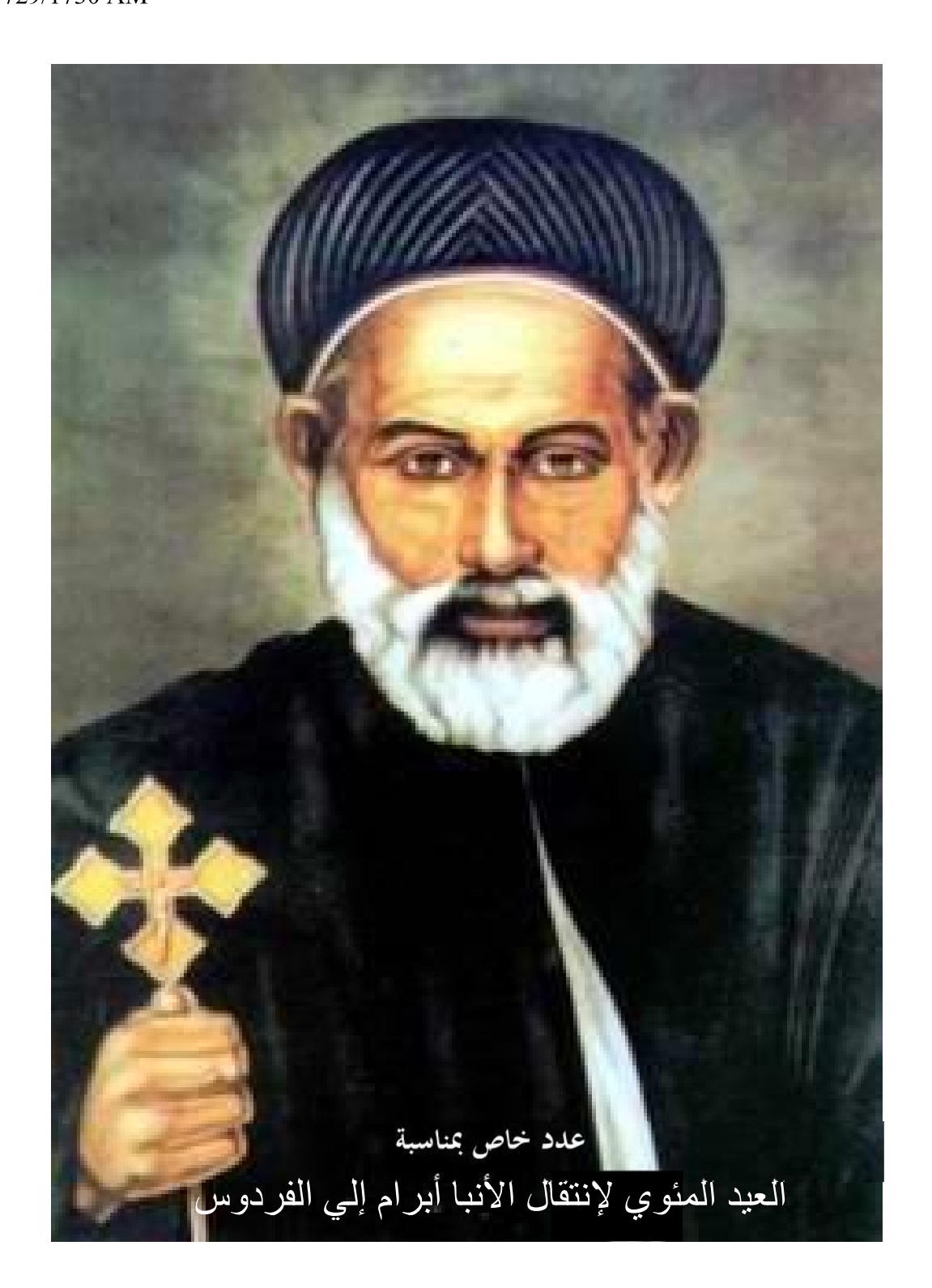
July 2014 Issue No. 3 - Year 2 Baounah/Abib 1729/1730 AM

NONPROFIT ORGANIZATION US POSTAGE PAID NEWRUNSWICK, NJ PERMIT NO 1316